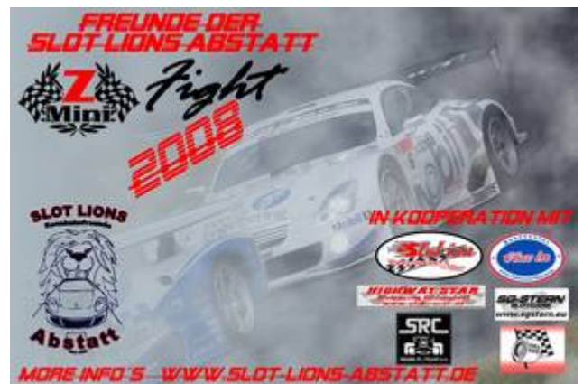
Offizielles Poster (extra für TOU ☺)

Ja und die Mühe hat sich gelohnt, man konnte 6 Clubs / Renncenter im Wilden Süden dazu bewegen uns zu unterstützen, dass wir bei Ihnen unsere Rennserie durchführen können.