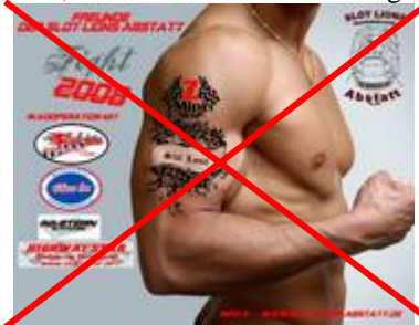
abgelehnt (schade ☺)

Da die Slot Lions schon öfters darüber nachgedacht hatten eine eigene Rennserie zu Organisieren, nahm das ganze seinen Lauf und der Ralle klemmte sich hinter die Organisation um was auf die Beine zu stellen. Etliche Telefonate wurden geführt und Mails mit den einzelnen Clubs / Renncentern hin und her verschickt, Plakate entworfen und ausgesiebt ☺