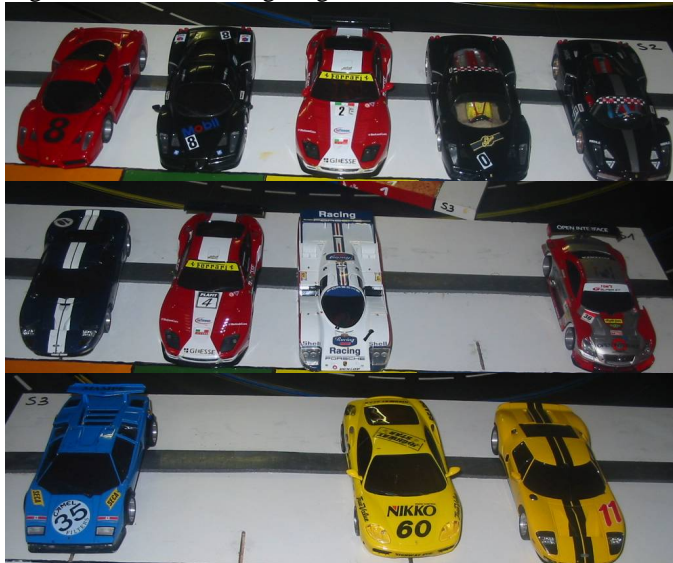
Viele verschiedene Fahrzeuge am Start!

Wieder fand sich ein Klasse Starterfeld mit vielen verschiedenen Fahrzeugen ein, und der eine oder andere hat sogar ein neues Fahrzeug aufgebaut.